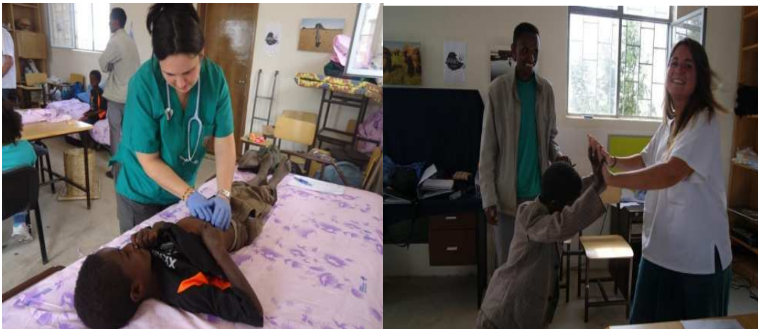
□ Diciembre de 2012. Formación en materia de higiene y seguridad alimentaria de personal sanitario y docente en Walmara. Charlas en la escuela y en la comunidad. Voluntariado Abay.