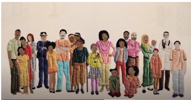
Imagen 5. Video “My body my rules”. https://www.dailymotion.com/video/x2wcj61