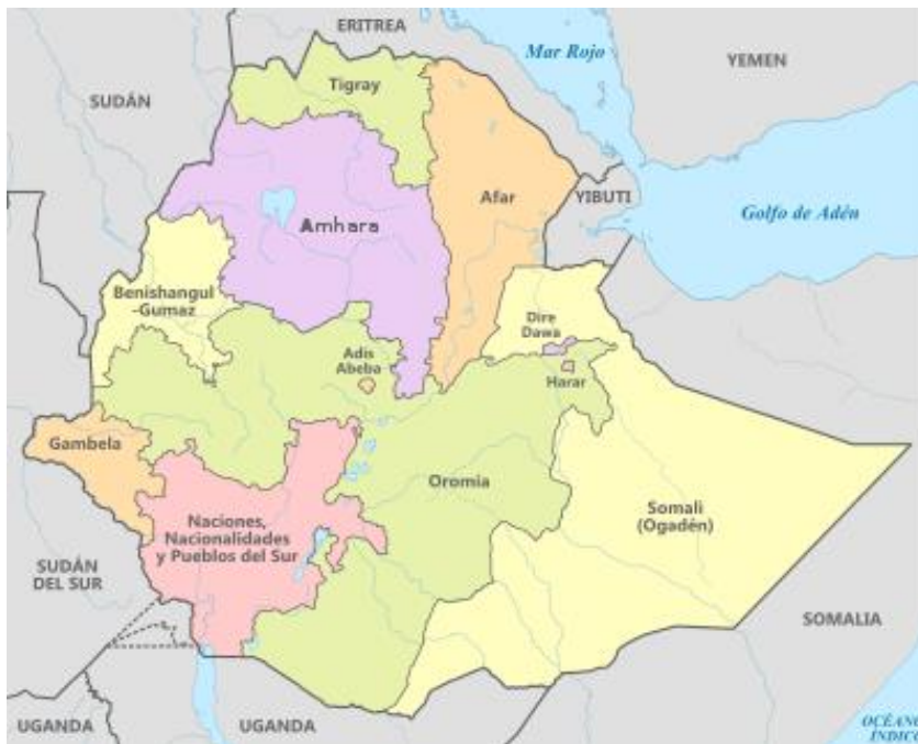
Imagen 1. Mapa de Etiopía, estados y fronteras.