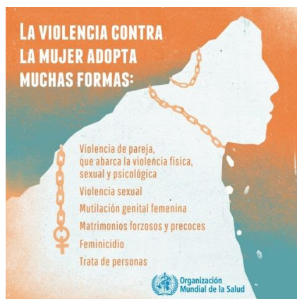
Imagen 4. Infografía formas de violencia.

A continuación, se abre un diálogo para que las niñas puedan debatir acerca de estas prácticas y cómo se posicionan ante ellas. (Violencia de pareja: física, psicológica, sexual. Violencia sexual. Matrimonios forzosos. MGF. Femicidios. Trata de personas). 22